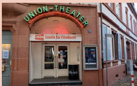
Lichtspieltheater in Kaiserslautern seit 1911.