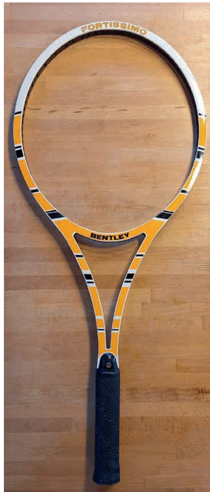
Bentley Fortissimo, 1972