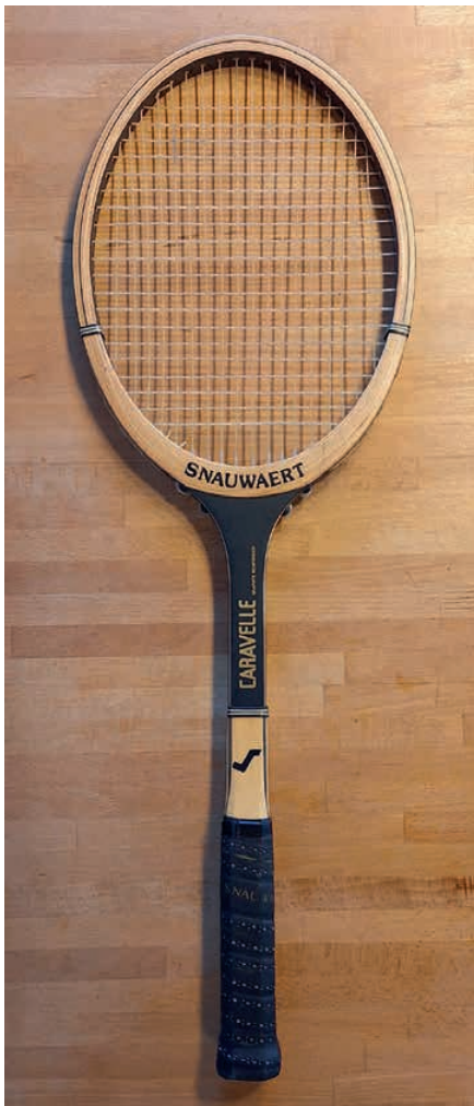
Sнауwaert Caravelle, um 1980