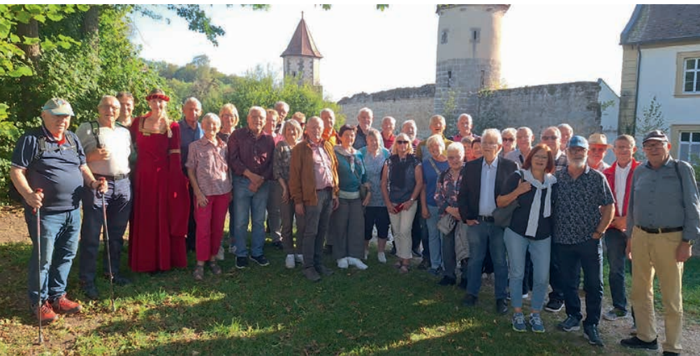
Mittelalterliche Stadtführung durch Seßlach.