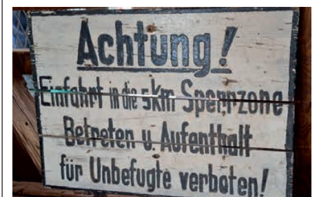
Schild im Zweiländermuseum Streufdorf.

Das Brauhotel & Gasthof Grosch in Rödentel bei Coburg war unser »Basislager«. Schon auf der Hinfahrt wurde mit dem Besuch der Wallfahrtskirche Vierzehnheiligen in Bad Staffelstein der erste Programmpunkt angesteuert. Es folgten die Besuche des Deutschen Schützenmuseums Schloss Callenberg, des Zweiländermuseums Streufdorf jeweils mit Führungen sowie eine Führung durch das »mittelalterliche« Seßlach. Am dritten Tag ging es geführt durch die Altstadt von Coburg, ehe die Veste Coburg besichtigt wurde. Gemeinsame Abendessen sowie eine Bierprobe rundeten das Programm ab. ◀