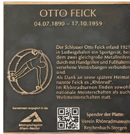
Bronzeplatte mit Rhönrad-Geschichte.