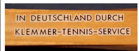
Aufkleber auf Holzschlägern.