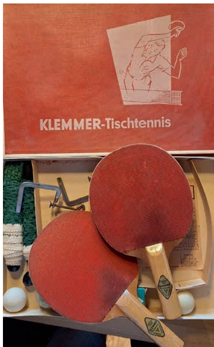
Klemmer-Tischtennis-Set, um 1960.