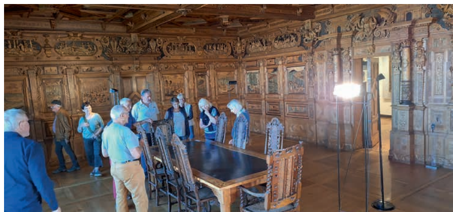
Führung durch die Veste Coburg.